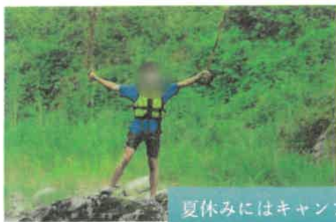
夏休みにはキャンプに行きました。 川遊び、BBQ、花火など楽しい思い出が 出来ました。