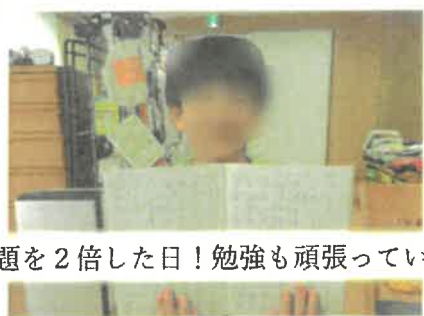
宿題を2倍した日！勉強も頑張っています。