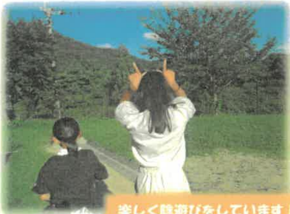
楽しく隠遊びをしています！