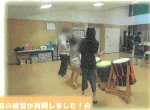
太鼓の練習が再開しました！自主練習も一生懸命取り組み、日々上達しています！