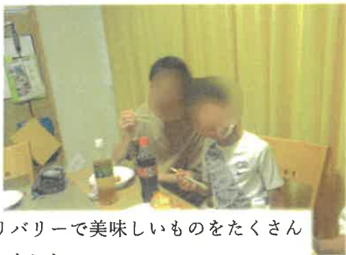
デリバリーで美味しいものをたくさん食べました。