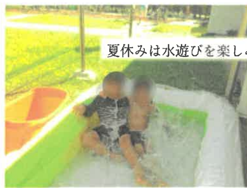
夏休みは水遊びを楽しみました。