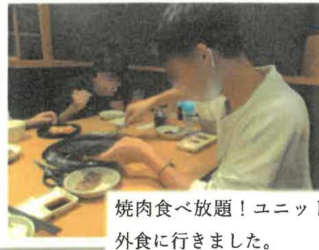
焼肉食べ放題！ユニットのみんなで外食に行きました。