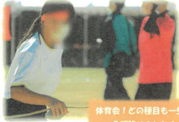
体育会！どの種目も一生懸命頑張りました！