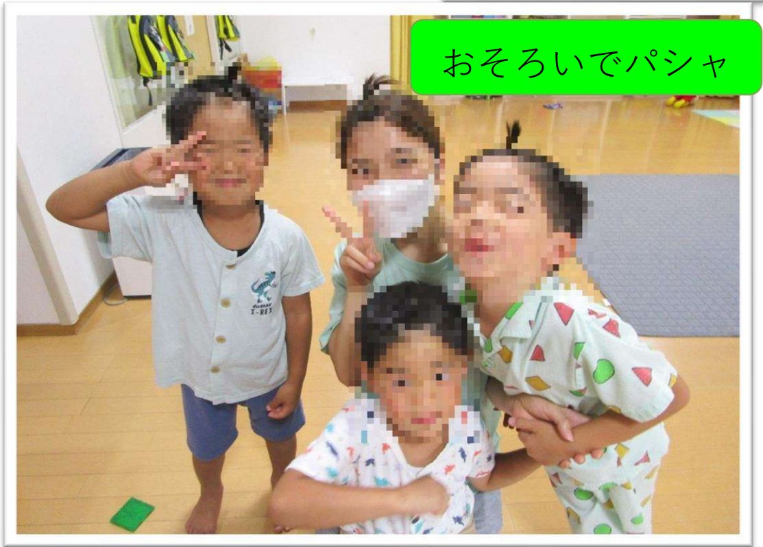
おそろいでパンシャ